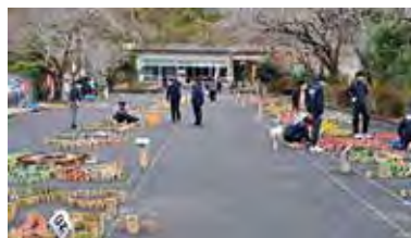
本城下ゆよしグループ グラウンドゴルフ