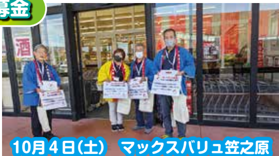
10月4日(土) マックスバリュ笠之原