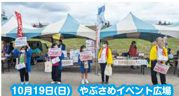
10月19日(日) やぶさめイベント広場