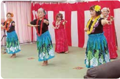
内之浦フラダンス同好会